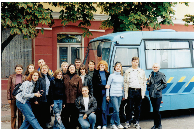
Екскурсія до Чернігова (вересень 2002 р.)