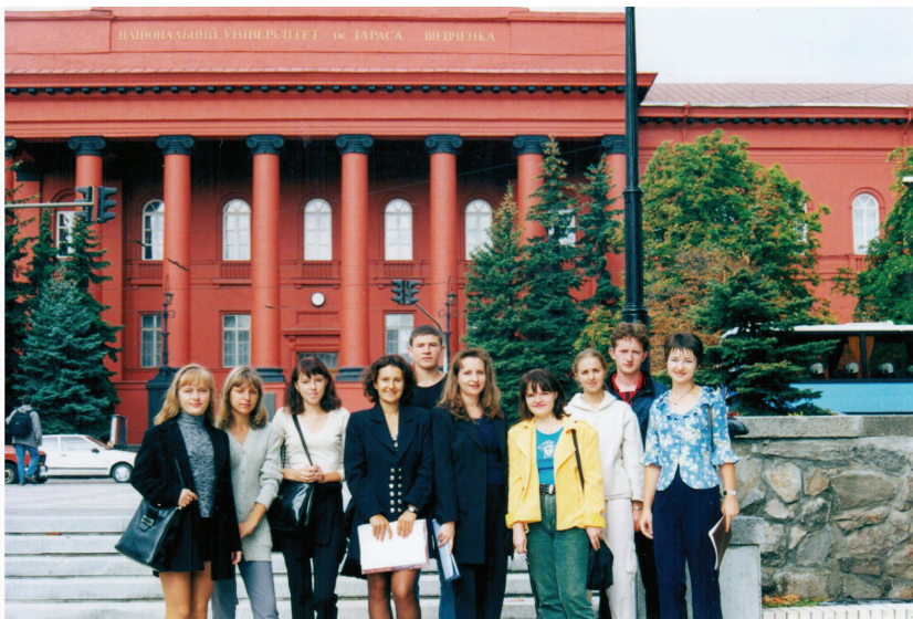
Група студентів – слухачів курсів підготовки екскурсоводів (2000 р.)